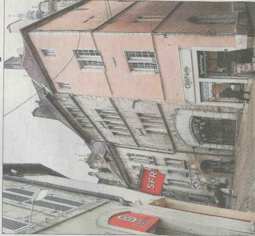
■ Situé 7, rue d'Enfer, le bâtiment a entièrement rénové. Le grenier a été aménagé, avec une annexe pour chaque logement.

L'objectif est de rénover une quinzaine de logements par an pour parvenir à 75 réhabilitations en 5 ans. Parmi les 33 logements rénovés depuis juillet 2016, 27 l'ont été par des propriétaires bailleurs et 6 par des propriétaires occupants. 25 de ces logements étaient très dégradés et un relevait de l'habitat