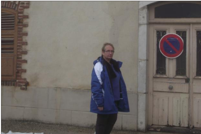
■ L'entrée du presbytère. Deux projets ont été proposés aux élus. Les travaux devraient débuter au printemps.

Les élus ont débattu de l'avenir du presbytère, fermé depuis les années 90. Quatre appartements vont être créés.